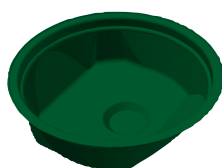
Fond de cuve avec cuvette pour installer un vide-cave

Xylem Water Solutions France SAS 29 rue du Port - Parc de l'Île 92022 Nanterre Cedex Tél. : 09 71 10 11 11 www.xylem.com/fr