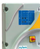
Coffret Ductor 2P-F