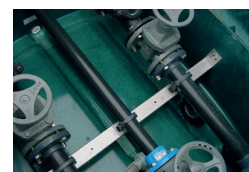
Intérieur du regard avec clapets et vannes