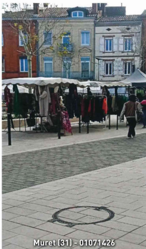
Muret (31) - 01071426