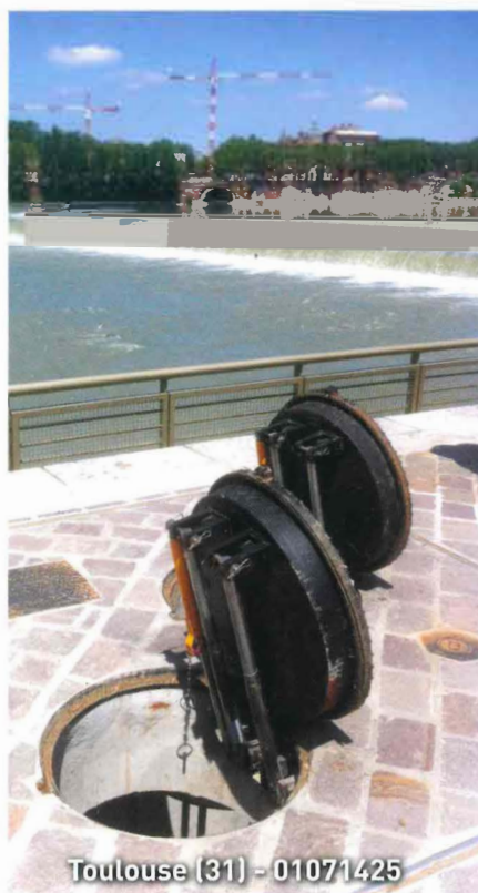
Toulouse (31) - 01071425