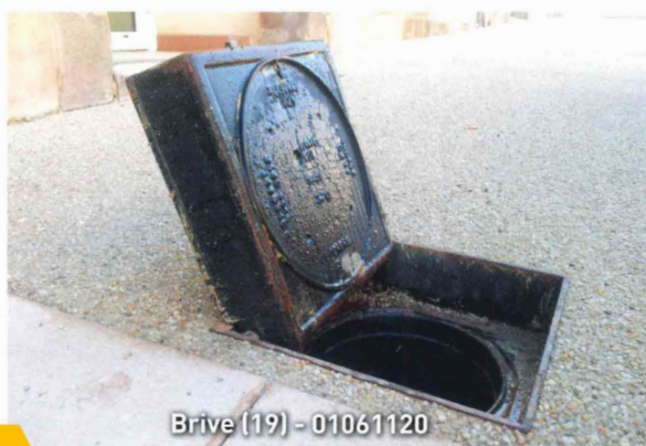
Brive (19) - 01061120