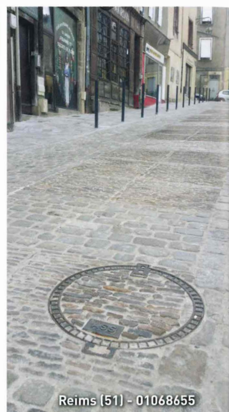
Reims (51) - 01068655