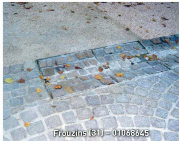
Frouzins (31) - 01068645