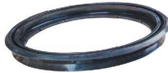
Anneau P C40, DN 150