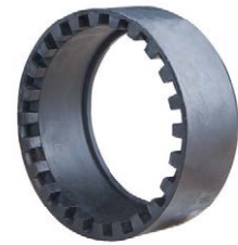
Anneau U C160, DN 150